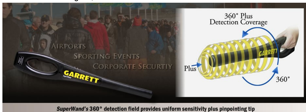
SuperWand's 360° detection field provides uniform sensitivity plus pinpointing tip