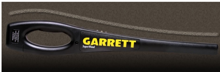
SuperWand combines sleek ergonomically design with performance.